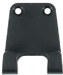
Soporte de pared