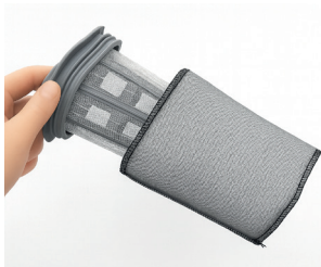
Sistema de filtración dual