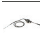
Detector de caudal incluido