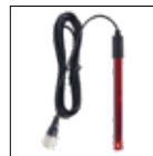
Kit sonda de Redox