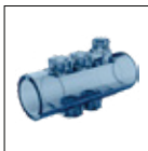
Soporte de sonda transparente de PVC incluido