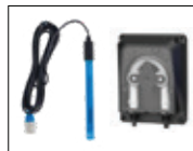
Kit de pH incluido